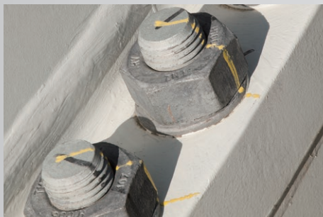
金属部件及螺栓的高效防锈