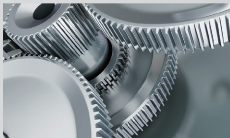
清洁风机金属部件油污